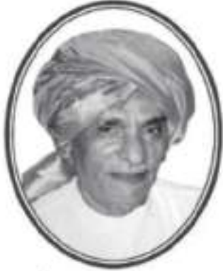
સ્વ. પોપટલાલ મોમાયા ગડા

શ્રી પુરસાદાદાની પહેડી સાથે ભક્તિ મહોત્સવ...!