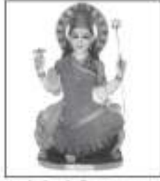
કુળદેવી શ્રી વિશલમાતાજી