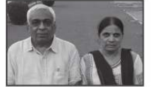
અ.સૌ. કાઈબેન અમરશી કરશન સત્રા