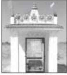
શ્રી ચાયાદાદા મેઘપર