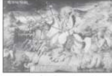
કુળદેવ શ્રી જામ્બહાદા